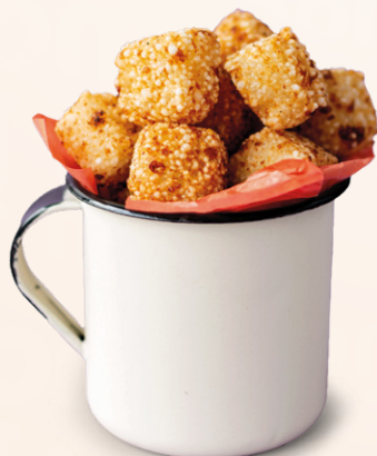
Dadinho de Tapioca